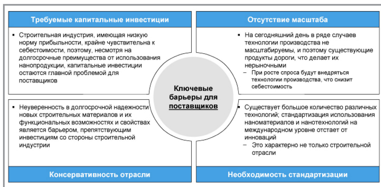
Рис. 3. Ключевые барьеры для производителей (поставщиков) нанотехнологической продукции

У государства имеются различные возможности поддержки игроков для формирования рынка по всей цепочке создания стоимости, и в этом его основополагающая роль.