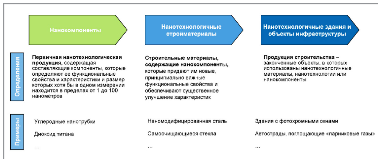
Рис. 1. Цепочка создания стоимости для нанотехнологий в строительстве

вения нанотехнологических стройматериалов в строительную отрасль, а также коммодитизации производства нанокomпонентов.