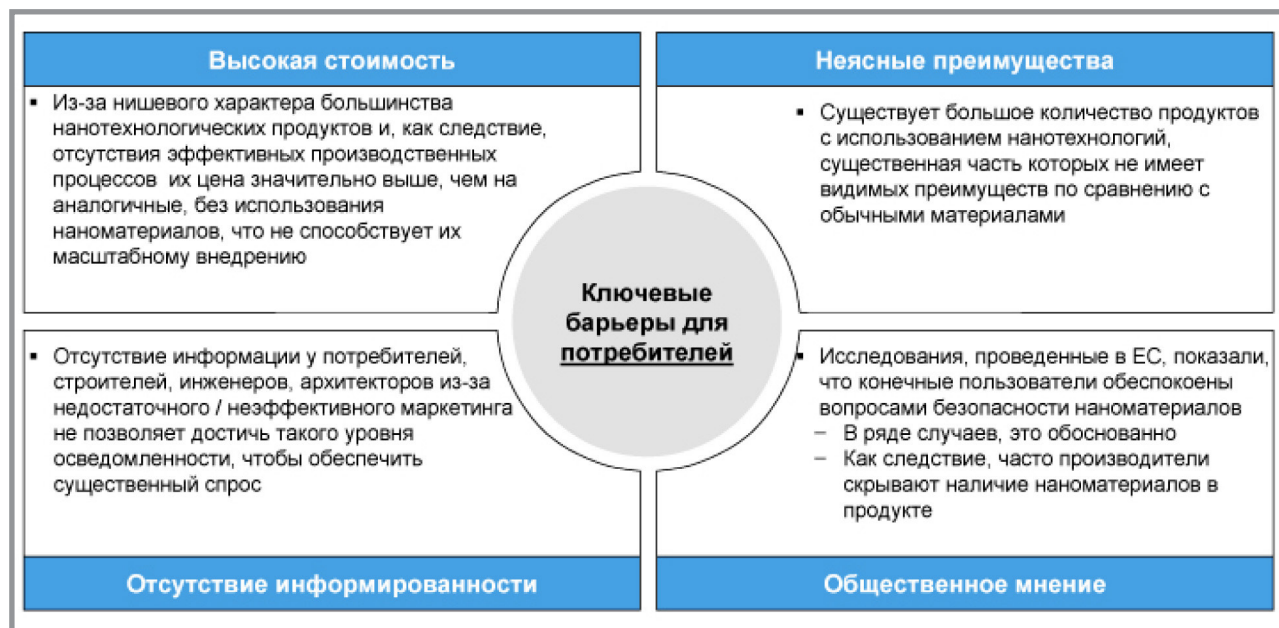
Рис. 4. Ключевые барьеры для потребителей нанотехнологической продукции

Приведем несколько характерных примеров.